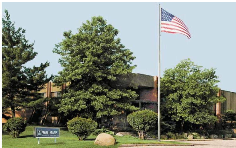
Всё производство Van Mark – от изготовления деталей до сборки – находится на заводе в Фармингтон Хиллз, штат Мичиган, США.

ББ: Всё производство Van Mark – от изготовления деталей до сборки – находится на нашем заводе в Фармингтон Хиллз, штат Мичиган, США. И этим мы гордимся. Гордимся собственным новаторским дизайном, стопроцентным