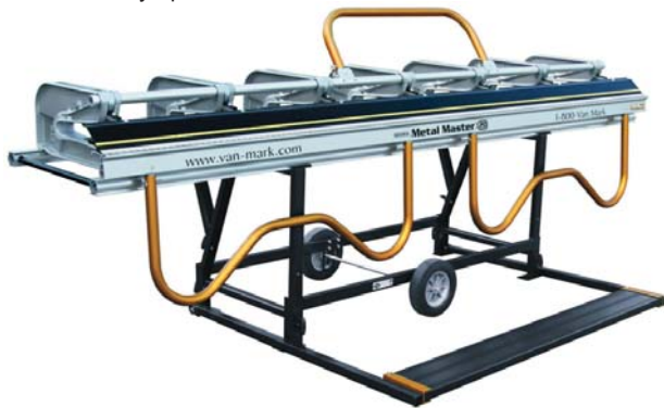
Современный листогибочный станок Van Mark Metal Master Industrial.

Индустрия прошла долгий и интересный путь от выпуска деревянных листогибочных агрегатов до новейших листогибов серии Metal Master Industrial, вобравших лучшее из лучшего. Это передовые технологии в проектировании. Это высокая производительность. И, безусловно, долговечность – конёк Van Mark. Материалы, из которых изготавливаются листогибы, – ещё одна наша гордость. Во-первых, они также 100% производства США, а, во-вторых, они отличаются особым качеством. Эти материалы применяют даже в автомобильной и аэрокосмической индустриях!